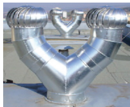
VENTILA PK -predĺžovací kus